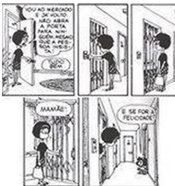
Mafalda, de Quino

Na sociedade capitalista contemporânea, sob a égide do neoliberalismo, que a tudo nega (a História, a territorialidade, os antagonismos de classe) e que promulga a democratização do conhecimento através do "livre acesso" à "informação", reafirmar a subjetividade e a criatividade como lócus privilegiado do saber é tarefa premente de todo educador que tenha na emancipação dos indivíduos e na construção de um outro mundo possível, o norte de seu trabalho.